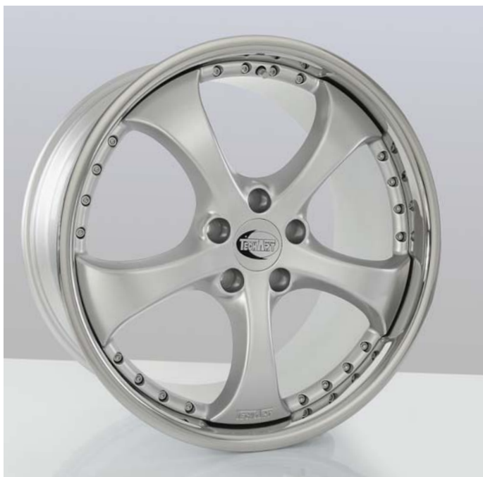
22-Zoll TECHART Formula II Rad in Shiny Silber 22-inch TECHART Formula II wheel in Shiny Silver

The center lock forged wheel TECHART Formula Race embodies the ideal combination of rigidity, weight and the inimitable styling of the unique TECHART twin-spoke design. In other words: 10% less weight compared to the 20-inch TECHART Formula III forged wheel and impressive 25% less weight compared to a conventional light alloy wheel of the same size.