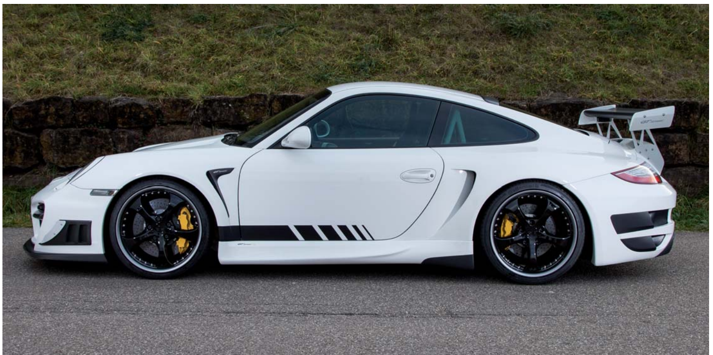
Der TECHART GTStreet RS auf Basis des Porsche 911 GT2 ausgestattet mit den TECHART Formula II GTR Leichtmetallrädern in 20-Zoll. The TECHART GTStreet RS based on the Porsche 911 GT2 equipped with the TECHART Formula II GTR light alloy wheels in 20-inch.