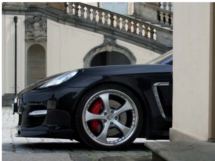
TECHART AeroKit für den Panamera mit TECHART Formula II Leichtmetallrädern in 22-Zoll TECHART AeroKit for the Panamera with TECHART Formula II light alloy wheels in 22-inch