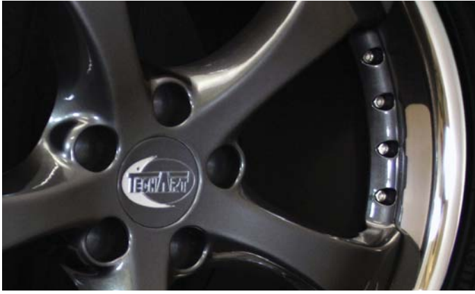
TECHART Formula II Leichtmetallrad in Mercury TECHART Formula II alloy wheel in Mercury