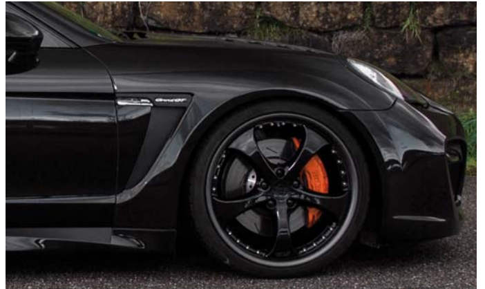
TECHART Formula II GTR Leichtmetallrad TECHART Formula II GTR light alloy wheel