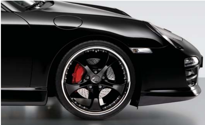
TECHART Formula II GTS Leichtmetallrad TECHART Formula II GTS light alloy wheel