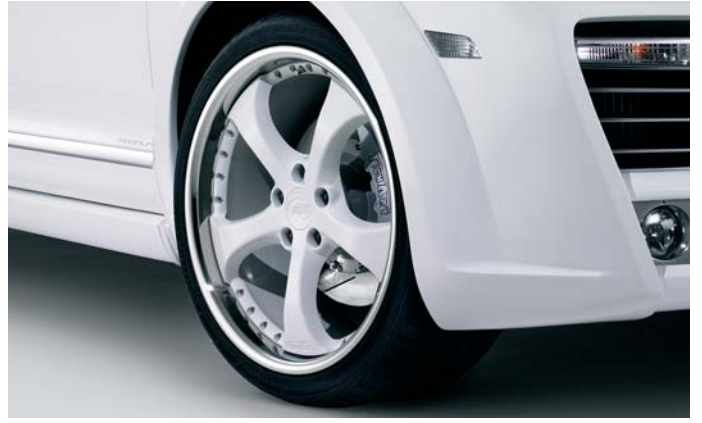
22-Zoll TECHART Formula II Leichtmetallrad in Wagenfarbe 22-inch TECHART Formula II light alloy wheel in body color