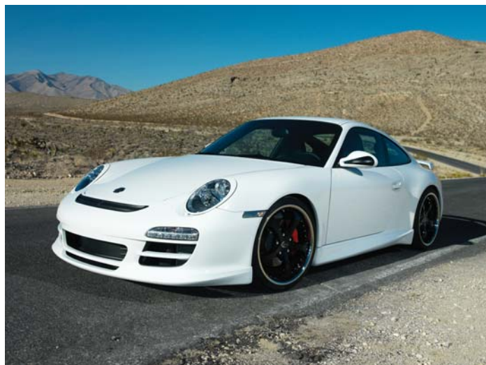
TECHART für den Porsche 997 ausgestattet mit Formula II GTS in schwarz glänzend TECHART for the Porsche 997 equipped with the Formula II GTS in gloss black