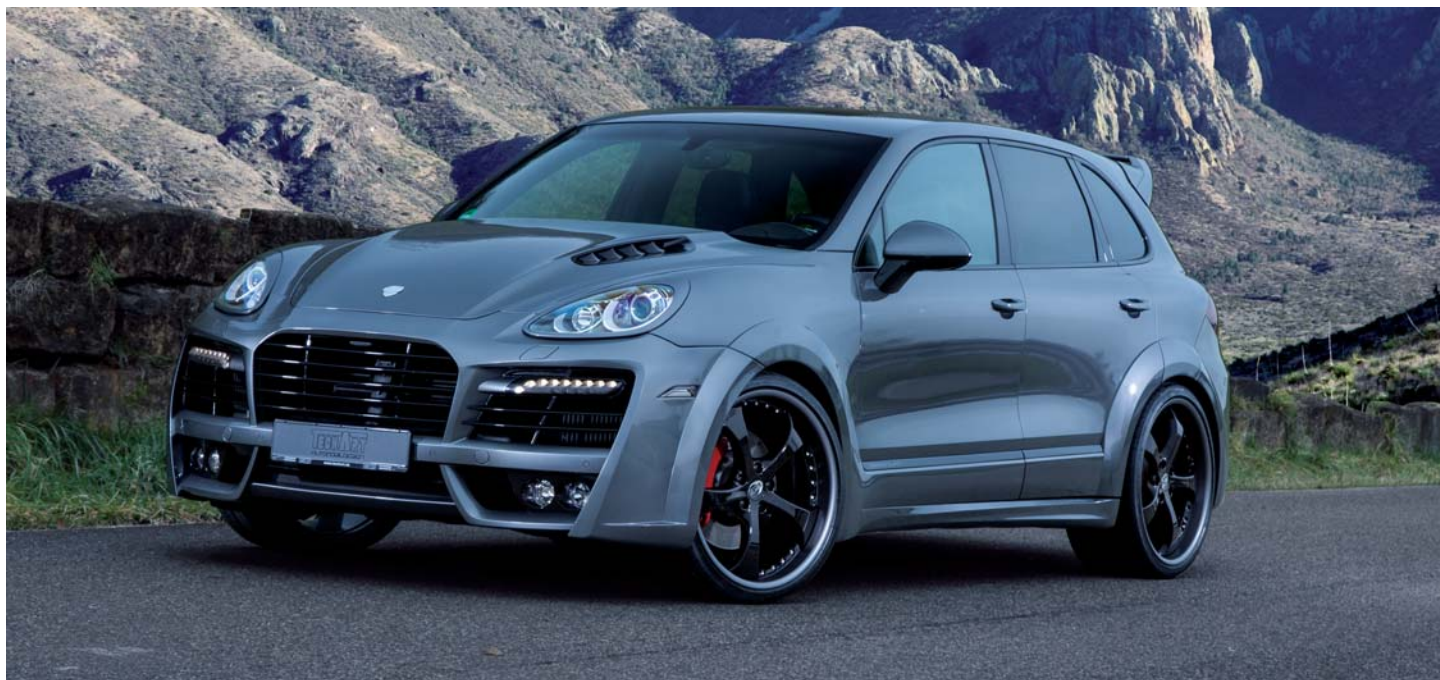
TECHART Formula II GTR in 22-Zoll auf dem TECHART MAGNUM auf Basis Porsche Cayenne Turbo TECHART Formula II GTR in 22-inch at the TECHART MAGNUM based on the Porsche Cayenne Turbo