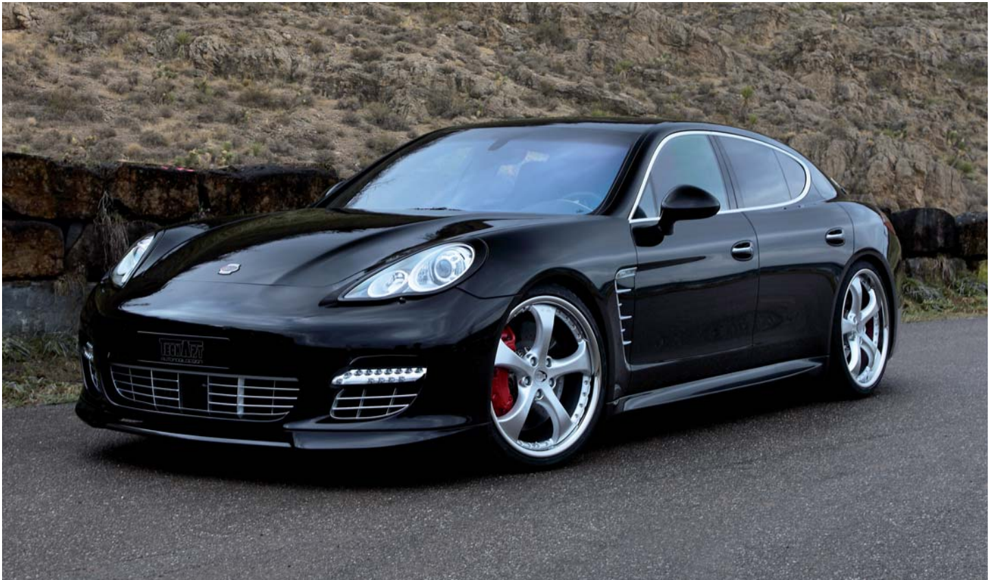
Porsche Panamera ausgestattet mit TECHART Aerokit I sowie 22-Zoll TECHART Formula II Rädern in Shiny Silber Porsche Panamera equipped with TECHART Aerokit I and 22-inch TECHART Formula II wheels in Shiny Silver