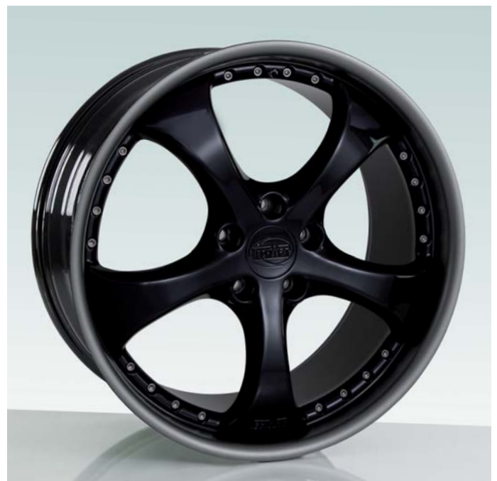
TECHART Formula II GTR in schwarz hochglanz und titangrau matt lackiert TECHART Formula II GTR in a high-gloss black color & meteor grey matt